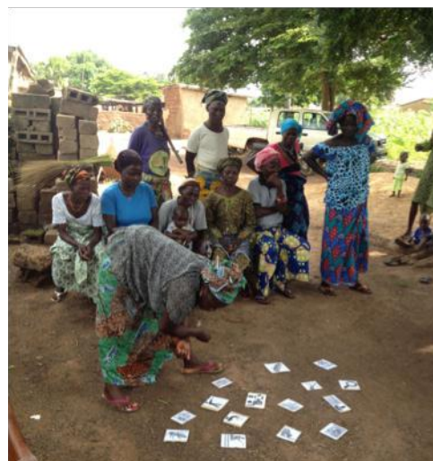
Fig. 4. Groupe de discussion effectué dans un village riverain de la RB Pendjari, pour identifier les SE prioritaires.