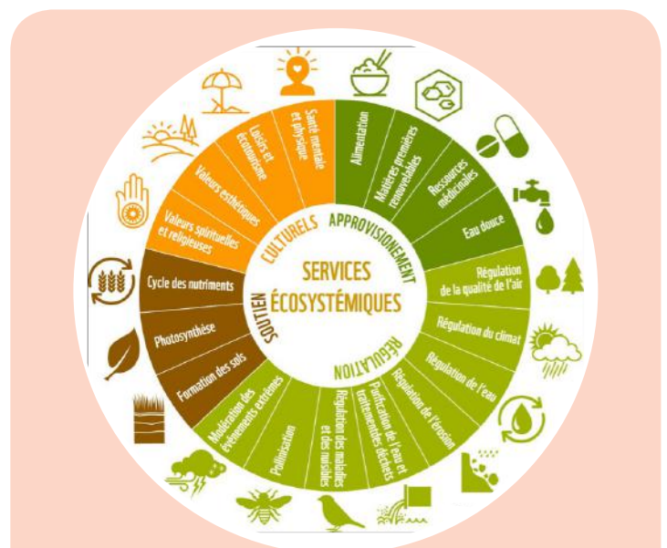
Fig. 1. Les écosystèmes fournissent des services dont dépendent directement les populations, en particulier celles vivant proches d'aires naturelles.